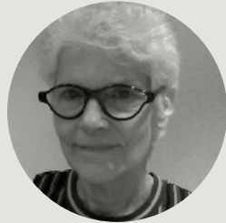
France Picard Université Laval